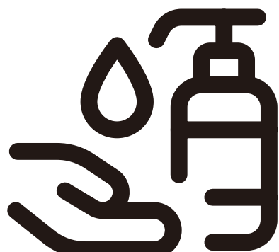
こまめな手指の消毒