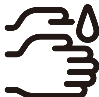
こまめな手洗いうがい